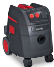
Szívógép elektromos kéziszerszámokhoz

Az IS és HS széria víz- és porszívó gépei az iparnak és iparosoknak kínálnak kiváló megoldást a legkülönbözőbb feladatokra. Igényes felhasználóknak készül, elsősorban az elektromos kéziszerszámoknál keletkező por elszívására. A kifejlesztett szűrőrendszer s ennek automatikus tisztítása új lehetőségeket nyitott a szívóerő fokozásában, a porvisszatartásban és a tartósságban.